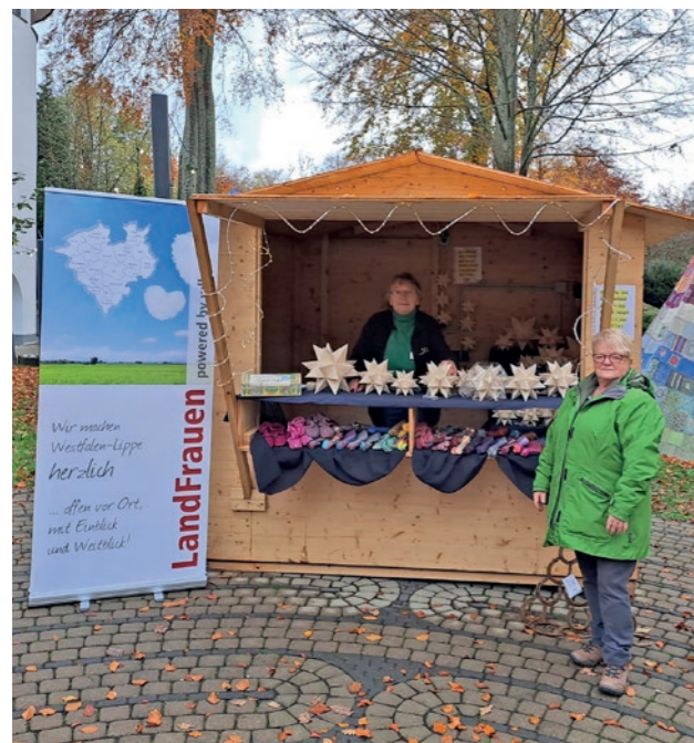
Wir danken den Landfrauen Anzhausen für ihre großzügige Spende!