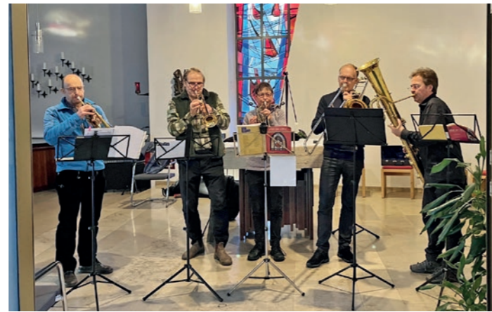
Adventskonzert der Blechbläser am 3. Dezember