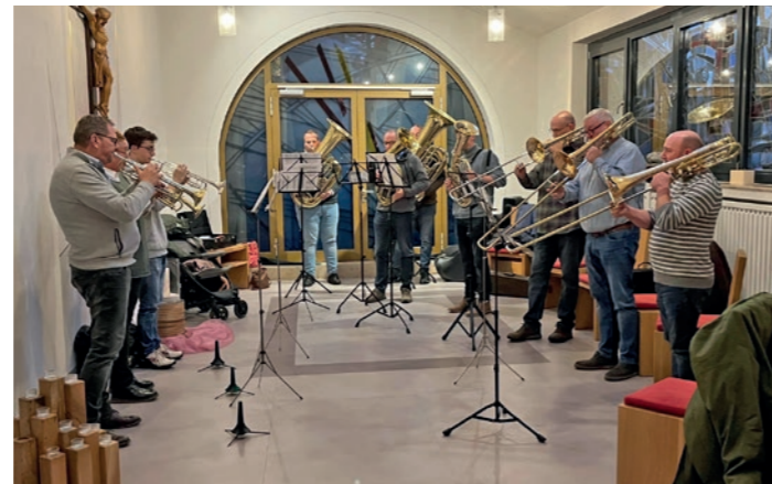
Nikolauskonzert der Daadener Knappenkapelle